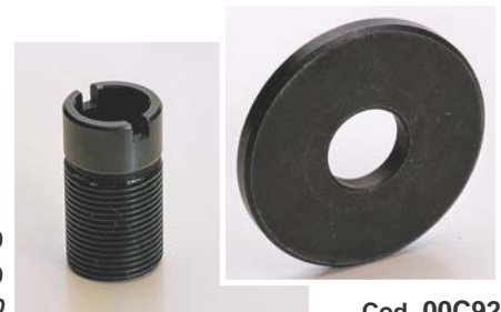
Cod. 00RC90 Riduzione per 00C90 Adapter for 00C90